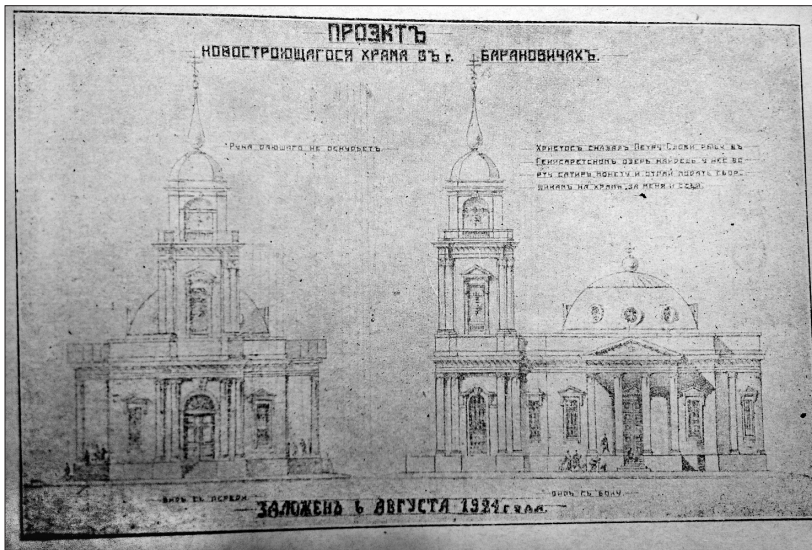
Малюнок 1. – Проект Баранавіцкага Пакроўскага сабору