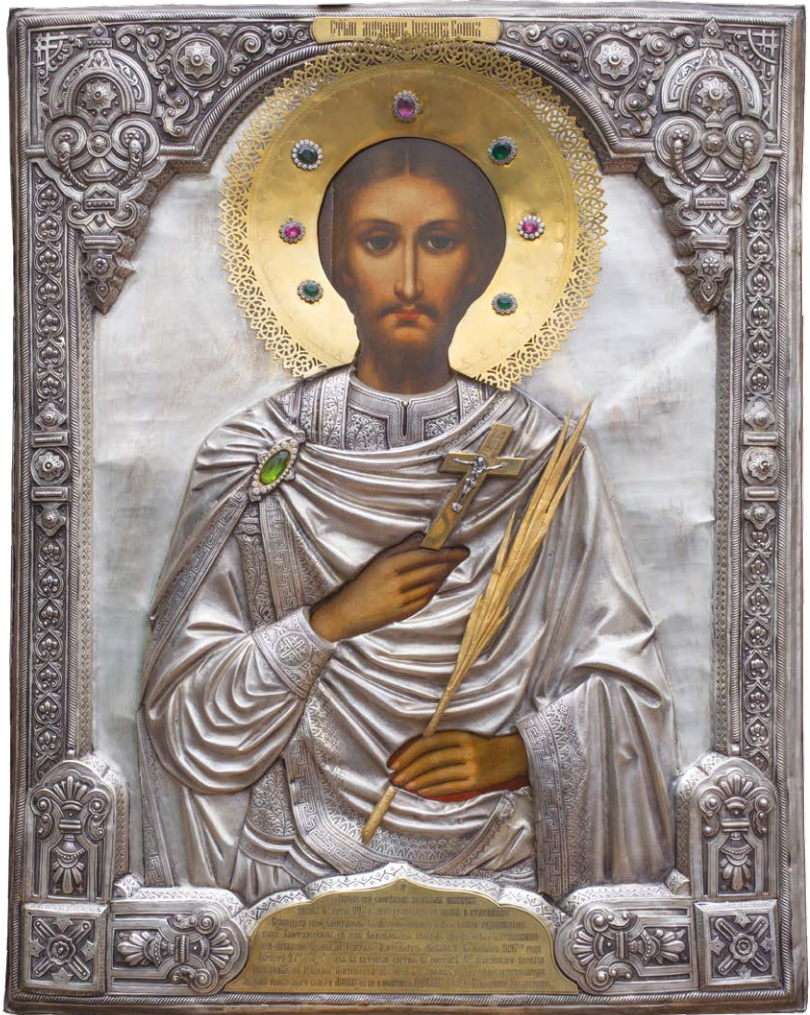
Икона святого мученика Иоанна Воина, хранящаяся в церкви святого Александра Невского