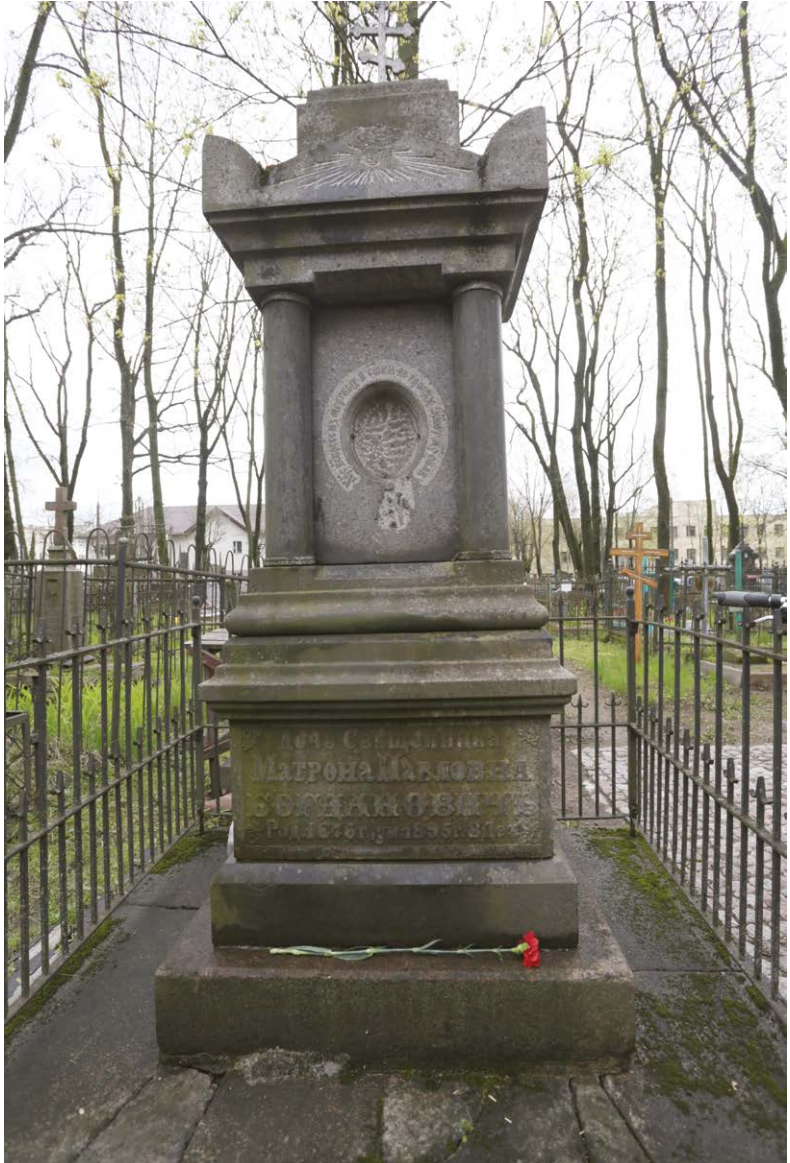
Могила Матроны Павловны Богданович. Современное фото