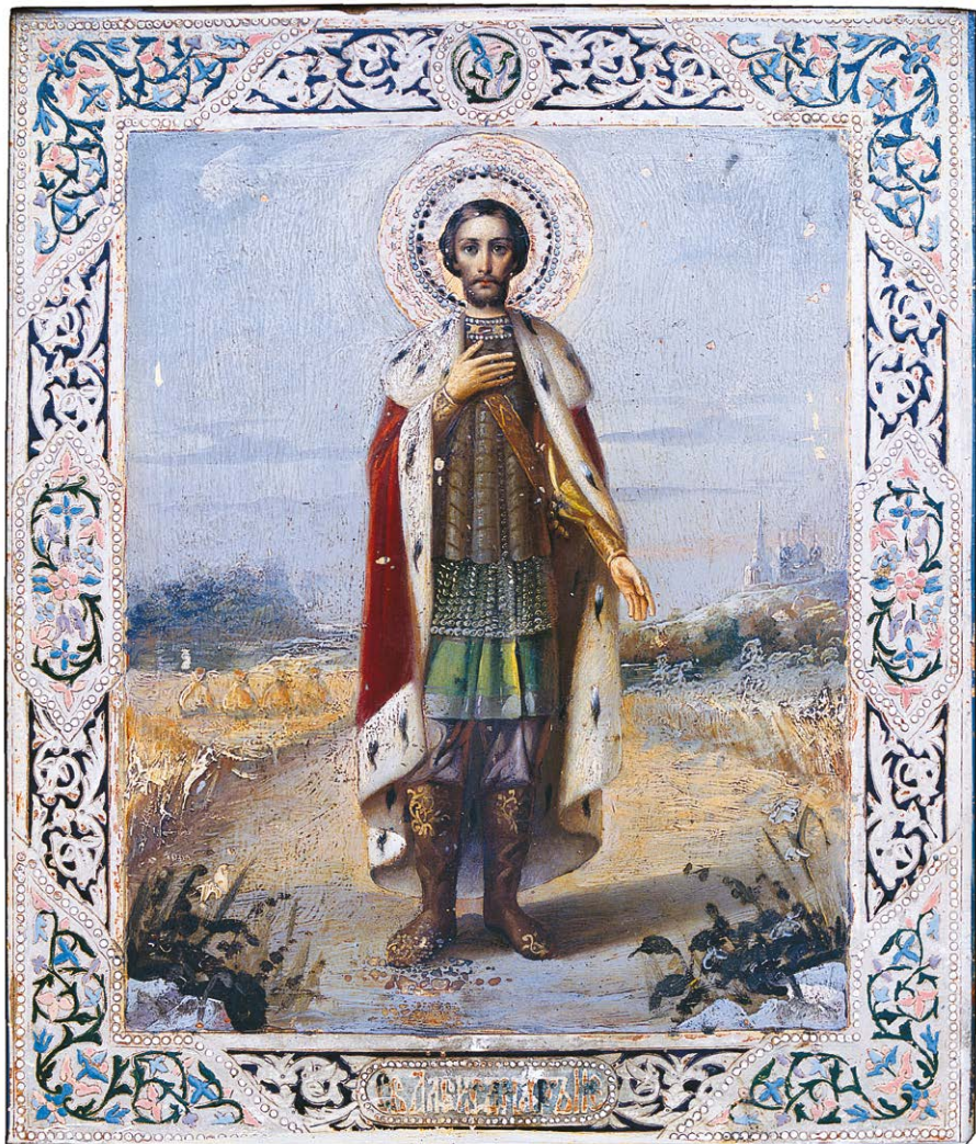
Храмовая икона святого благоверного великого князя Александра Невского.