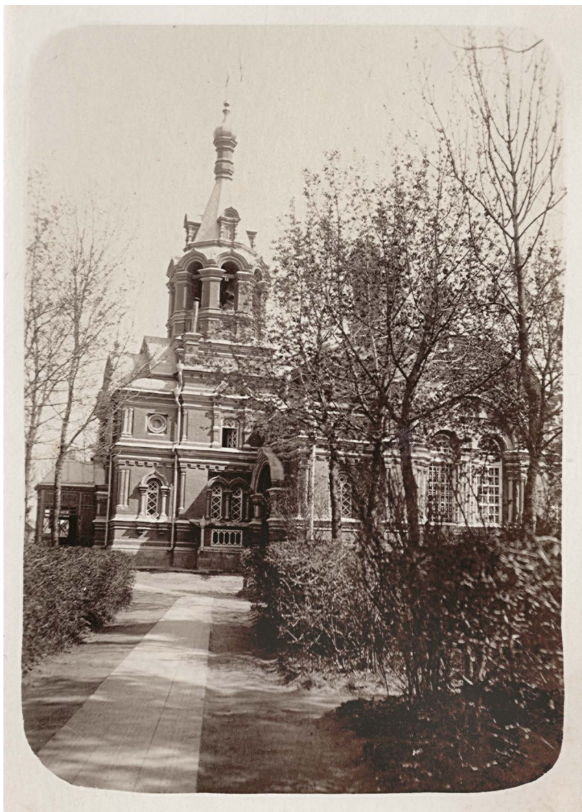
Церковь святого Александра Невского. Фото 1918 г.