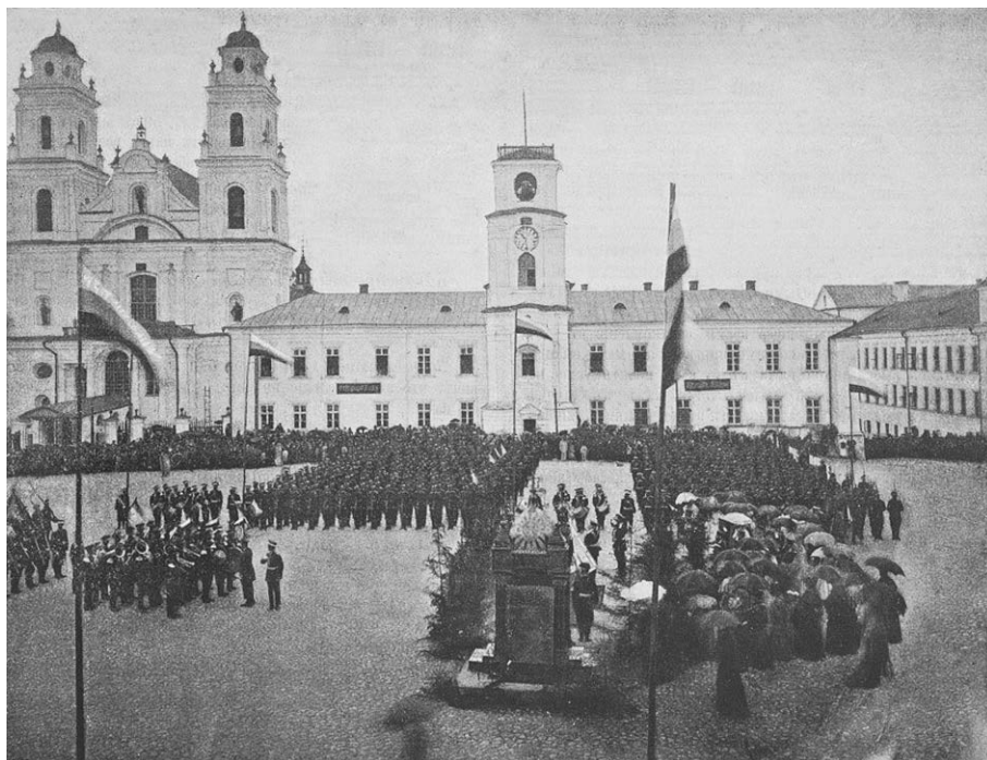
Минск. Соборная площадь. Военный парад по случаю 100-летия 119-го пехотного Коломенского полка 17 мая 1897 г. На фото перед полком стоит киот-часовня с полковой иконой Преображения Господня

хронике: «Приходским советом было принято решение отреставрировать киот-часовню накануне 120-летия Александро-Невского храма, а вот самой походной церкви 120 лет исполнилось совсем недавно – она на год старше храмовых стен. ... Походный храм Воскресения Христова был создан в честь столетия 119-го Коломенского пехотного полка, а также в честь годовщины коронавания царя-страстотерпца Николая Второго и Государыни Императрицы Александры Фёдоровны – о чём упомянуто в закладной грамоте» 68 .