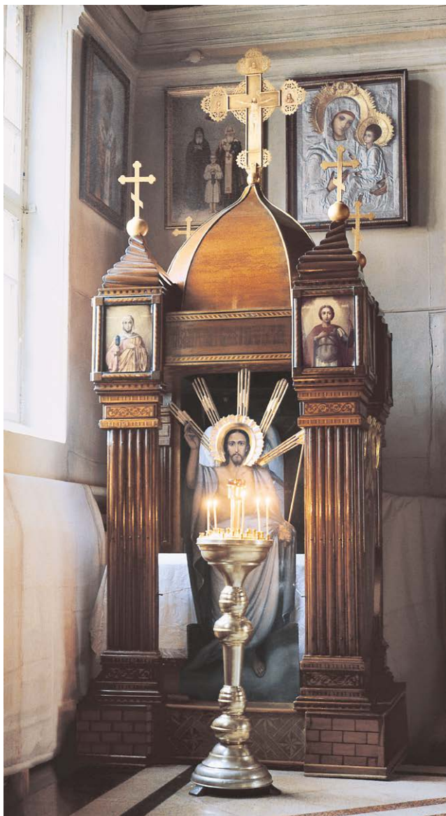
Киот-часовня, сооруженный к 100-летию юбилею 119-го пехотного Коломенского полка в 1897 г., хранящийся в церкви святого Александра Невского. Фото 1990-х гг.