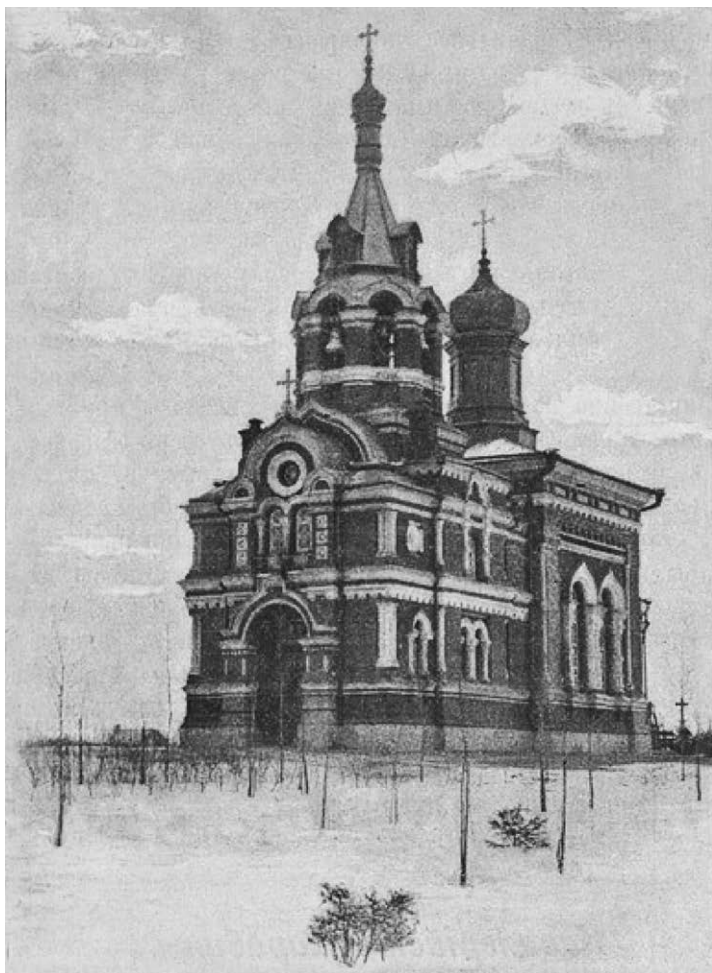
Церковь святого Александра Невского на минском Военном кладбище. Фото 1898 г.

храма пока разыскать не удалось, поэтому говорить о первоначальном проекте сложно. Возможно, мысль о пристройке приделов появилась позже. Но как бы то ни было, задумку смогли реализовать лишь после того, как были изысканы «на сей предмет средства».