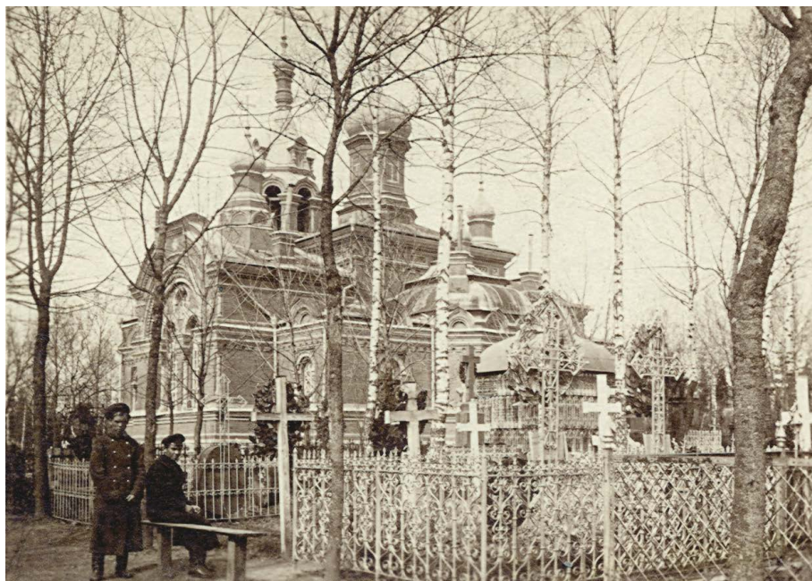
Церковь святого Александра Невского. Фото 1910-х гг.

сподня и считался не только полковым, но и общелагерным. Служили в лагерном храме полковые священники поочередно.