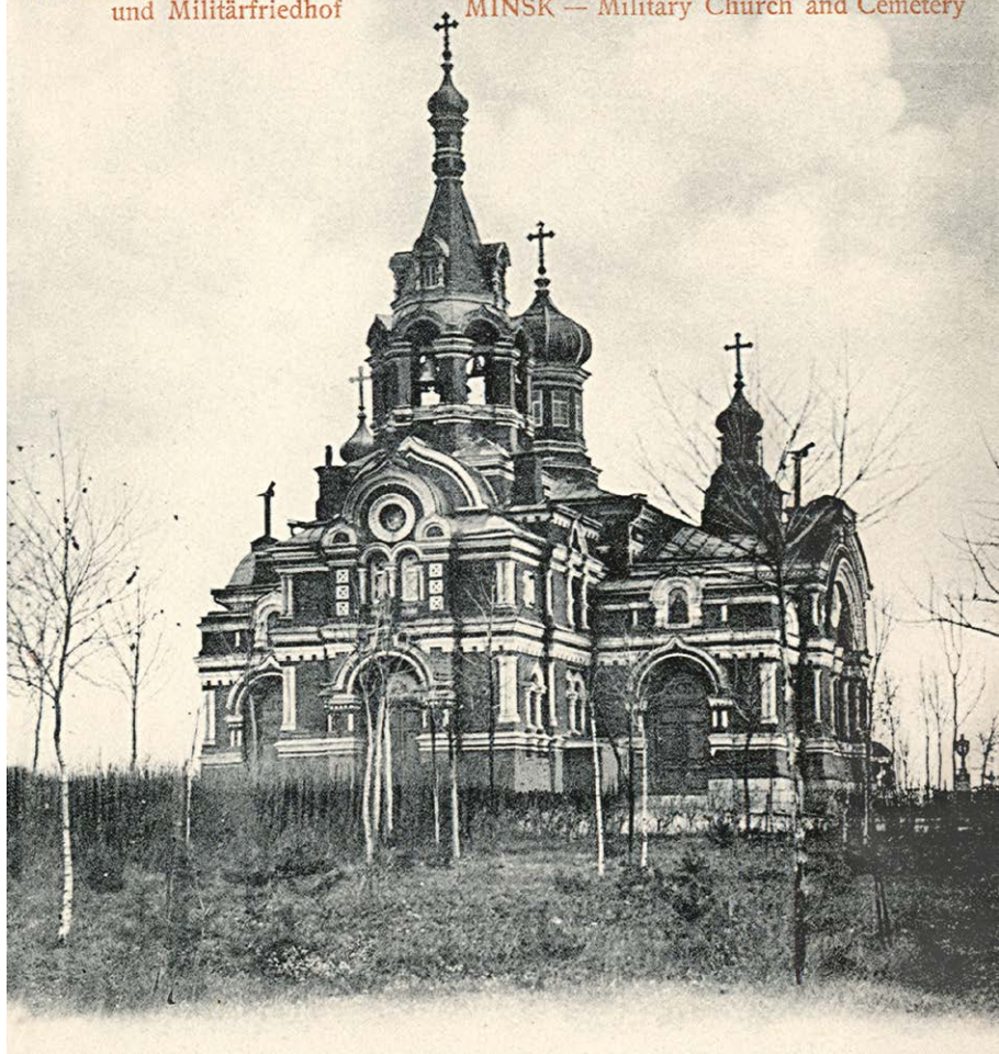
Церковь святого Александра Невского. Фото нач. 1900-х гг.

МИНСКЪ — Военная церковь Военное кладбище MINSK — Militärkirche MINSK — Eglise et Cimetière militaire und Militärfriedhof MINSK — Military Church and Cemetery