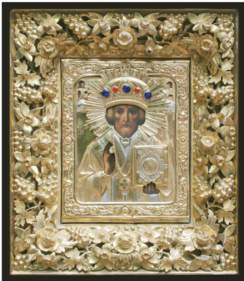
Икона святителя Николая Чудотворца (после реставрации), хранящаяся в церкви святого Александра Невского.

1906 года он находился в Маньчжурии и 27 июля вернулся к месту своей постоянной дислокации. В период отсутствия полка в городе богослужения в полковой Александро-Невской церкви не совершались.