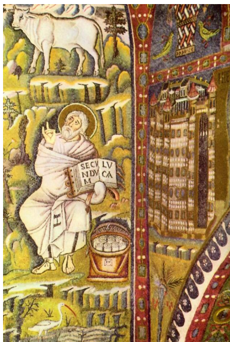
Рис. 5 – Изображение Луки с тельцом на мозаике церкви Сан-Витале