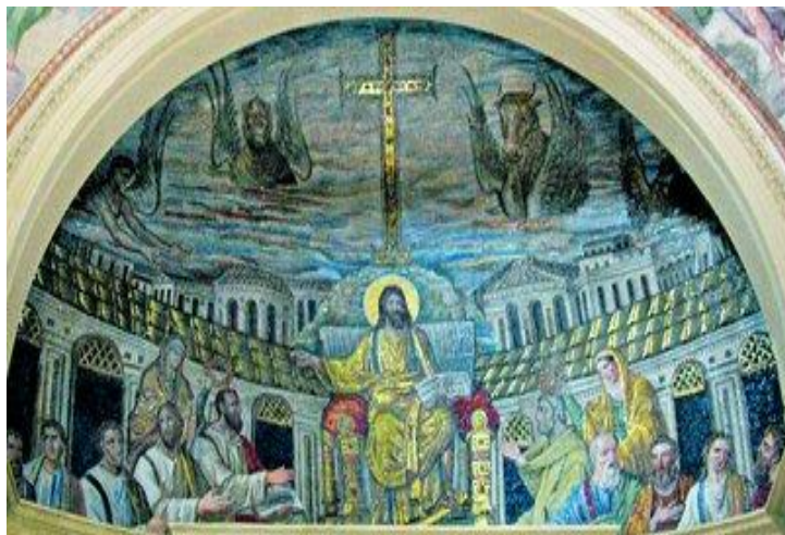
Рис. 1 – «Христос и апостолы». Мозаика конхи апсиды церкви Санта-Пуденциана в Риме