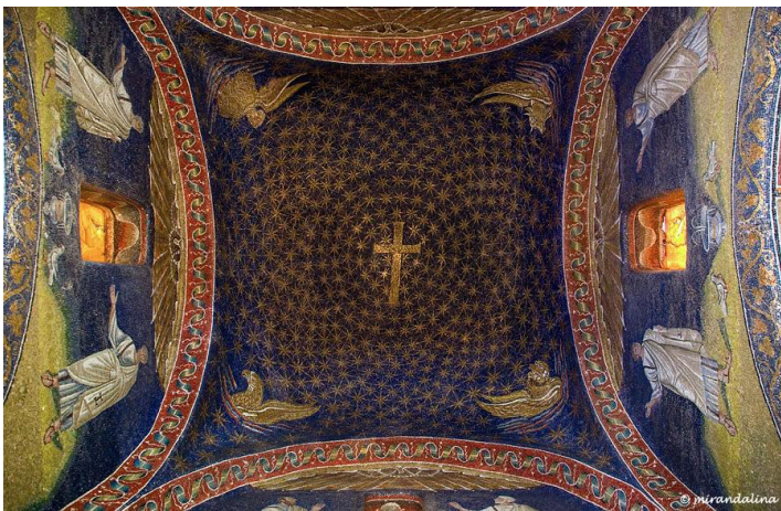
Рис. 2 – Арка апсиды церкви Санта-Мария Маджоре