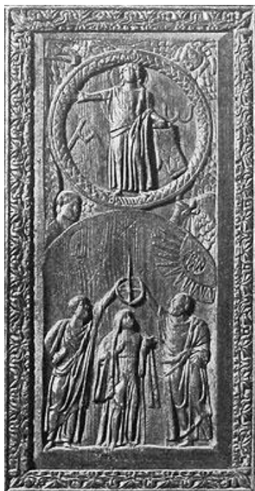
Рис. 3 – Рельеф врат церкви Санта-Сабина