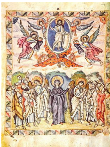
Рис. 6 – Вознесение в Четвероевангелии Раввулы