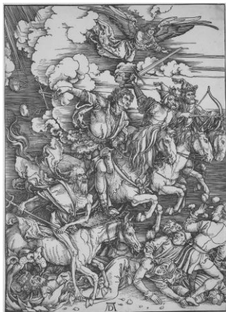
Рис. 2. Альбрехт Дюрер, Апокалиптическая серия, Четыре всадника (Откр. 6:2–8), Британский музей, Лондон