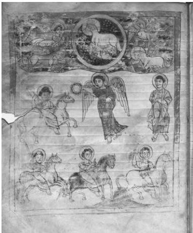
Рис. 1. Трирский Апокалипсис, XIX в., Четыре всадника (Откр. 6:2–8)