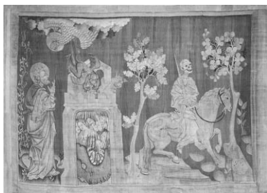
Рис. 4. Анжерский Апокалипсис, Четыре всадника (Откр. 6.7–8), Гобелен Анжерского замка