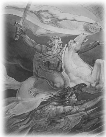
Рис. 5. Вильям Блейк, Смерть на Бледной лошади, 1800, Кембридж, Fitzwilliam