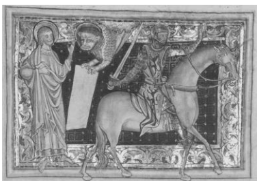
Рис. 3. Ламбетский Апокалипсис, Второй всадник (Откр. 6.3–4), Библиотека Ламбетского дворца, Лондон